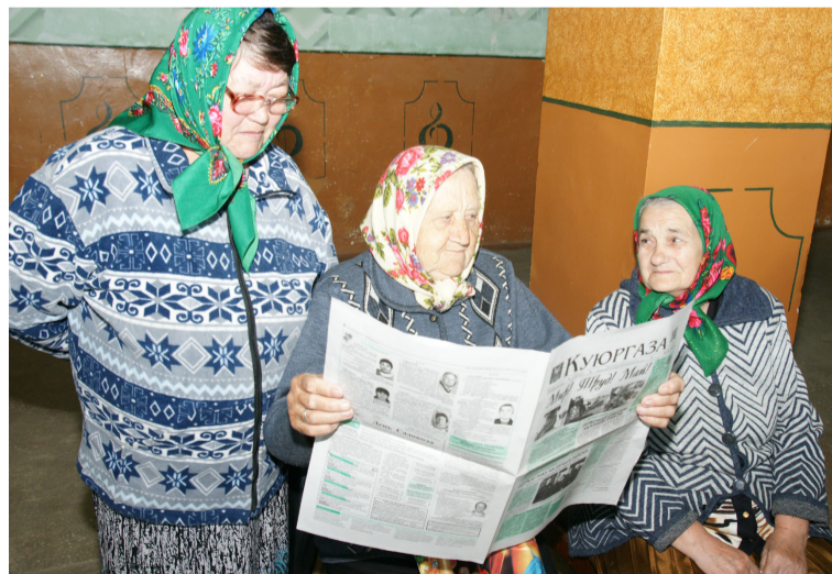
Первыми в Декаде подписки приняли активное участие наши читательницы из Бахмута.

Напоминаем, что вы можете выписать районку непосредственно в редакции и сами забирать газету: 6 месяцев – 408 руб., 3 месяца – 204 руб., 1 месяц – 68 руб.