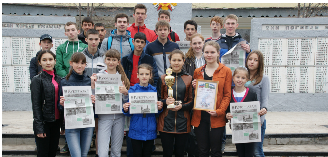
Традиционный снимок на память победителей эстафеты — обладателей кубка газеты «Куюргазы» — команды школы №1 села Ермолаево.

лодое поколение должно хорошо знать собственную историю, знать, что советский народ взял в руки оружие, чтобы защитить свою землю, своих детей, матерей!